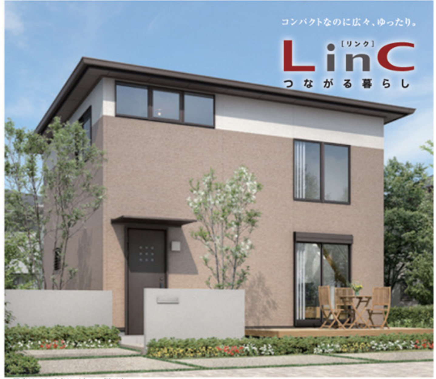
※写真は、LinC(リンク)の一例です。

※平成22年8月末 完成予定 土地建物総額 2,680万円 (税込) 外構工事 50万円相当含む ご返済プラン ●借入/2,680万円 ●35年返済 ●金利1.2%3年固定 ●ボーナス払いなし ●月々/78,180円