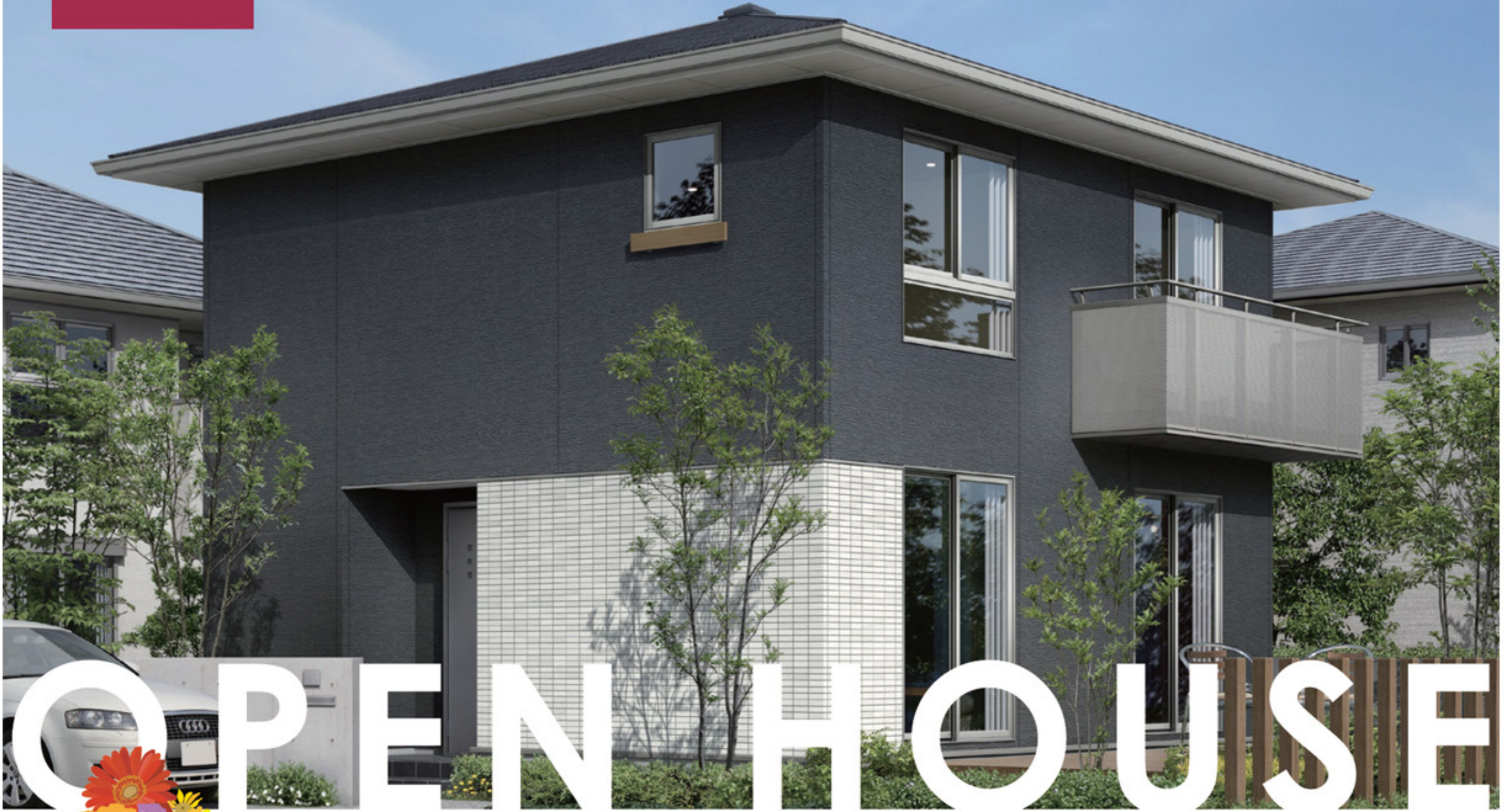
※写真はイメージです。実際とは異なります。

エス・バイ・エルは強さと美しさにこだわり、新しい 「日本らしさ」を求めた住まいづくりを進めています。 次の日本へ、次の住まいを。