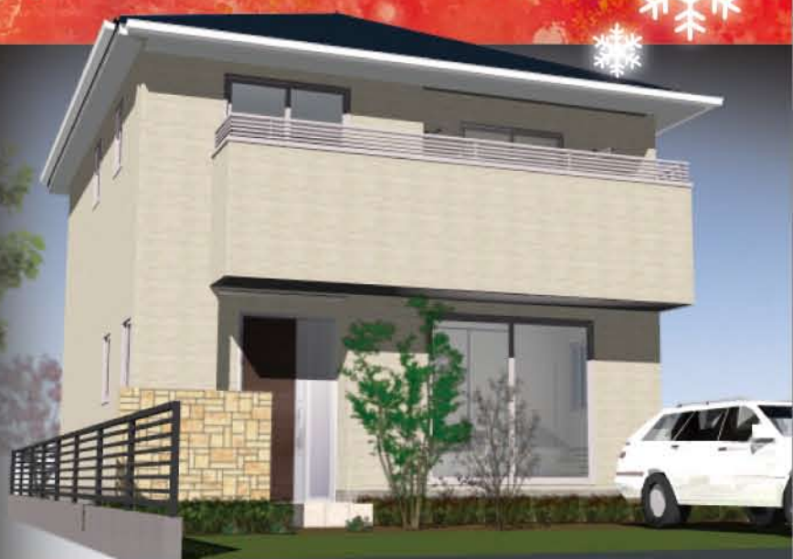
※ハースは完成イメージです。

建築美を追求し、広さと合理性、そしてプライバシーを守りながらも開放感と明るさに満たされる住居空間の実現を目指した住まい、設計力とデザイン力に、住まいづくりのための想いを込めて創出する。あなたとあなたのご家族のための住まいです。